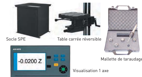
Mallette de taraudage